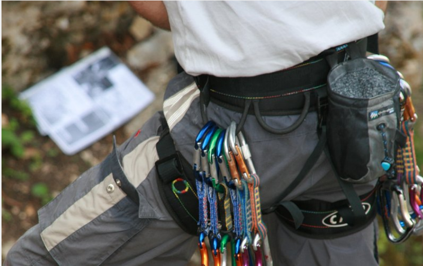
Équipement (Doubs Tourisme)