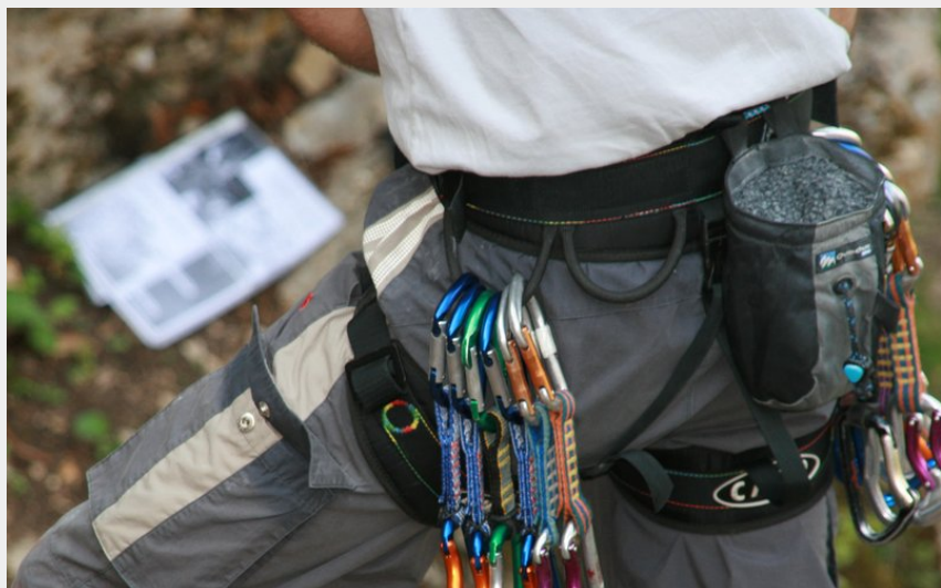
Équipement (Doubs Tourisme)