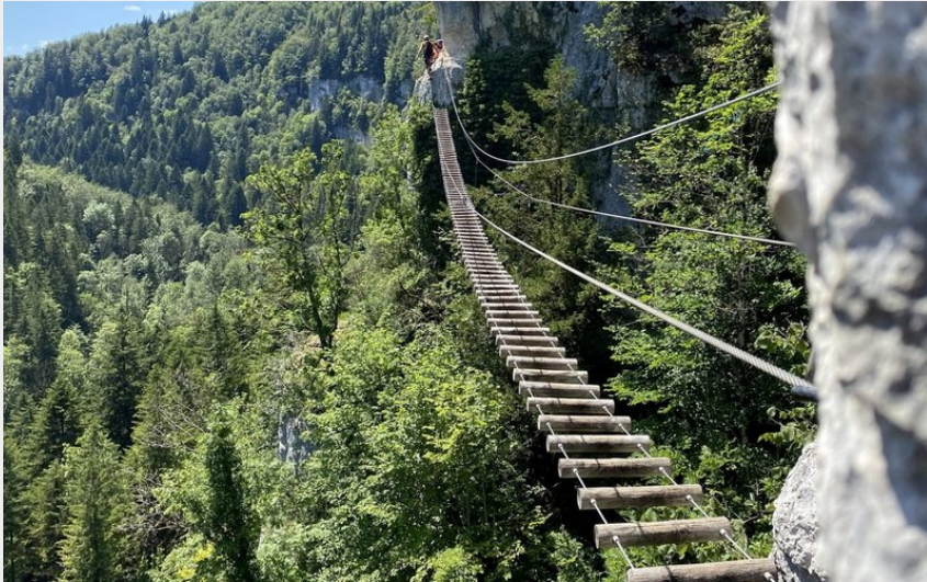
Via ferrata des Échelles de la Mort (Pays Horloger)