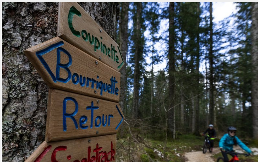
Signalétique des parcours (Sophie Cousin)