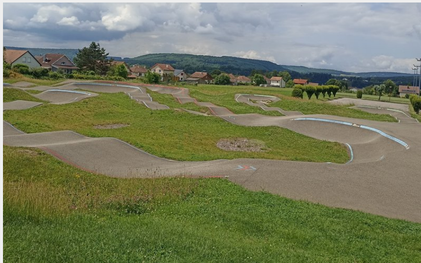
Vue d'ensemble de la Pumptrack (Deux Vallées Vertes)