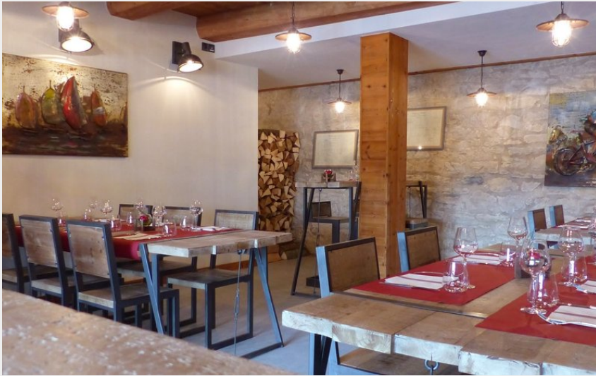
Crédit photo : RESTAURANT - L'ATELIER DE DONAT_1 (Atelier de Donat)