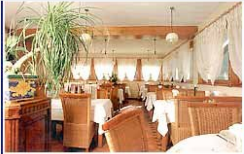
Crédit photo : RESTAURANT - LE SAUGEAIS_1 (RESTAURANT - LE SAUGEAIS)