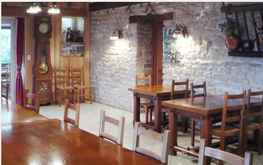
Crédit photo : Salle de restauration Ferme Auberge du Ligier (Ot Baume-les-Dames)