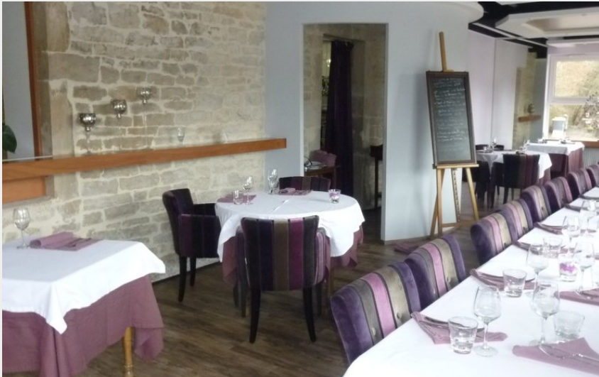
Crédit photo : Légende logo ou photo principale_1 (OT Baume-les-Dames)