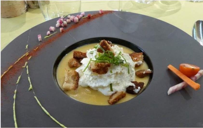
Crédit photo : Plat raffiné à l'Auberge du Château de Vaite (OT Baume-les-Dames)