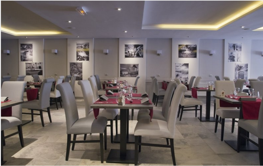
Crédit photo : RESTAURANT - LA TABLE DE GUSTAVE_1 (Table gustave 1)