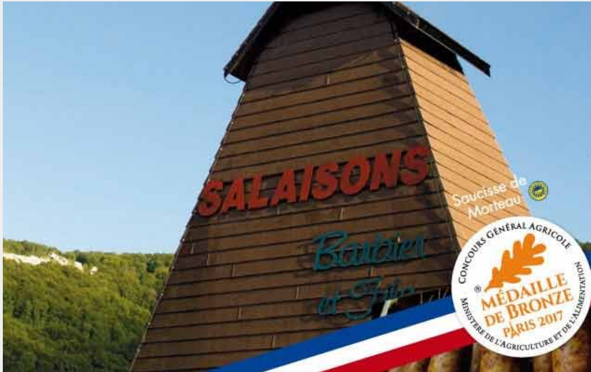
Crédit photo : LA MAISON BARBIER À PONT-DE-ROIDE_1 (Maison Barbier)