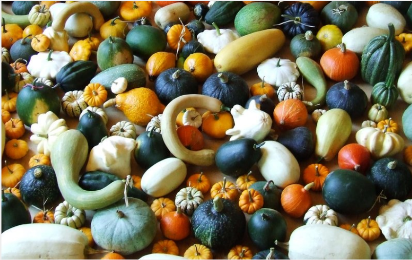
Crédit photo : LA SEMILLA DISTILLERIE AYMONIER Courges (La Semilla)