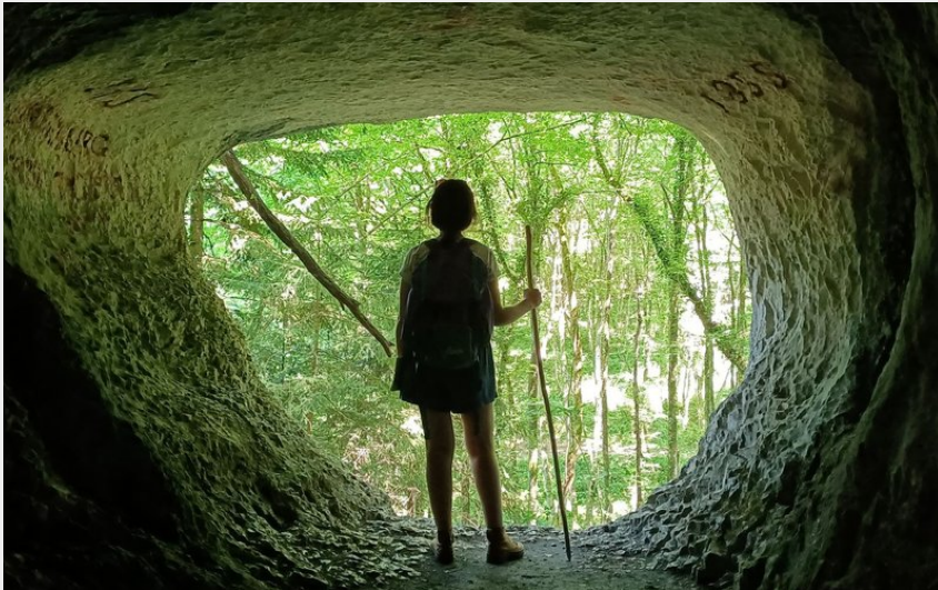
Grotte de la Tante Airie