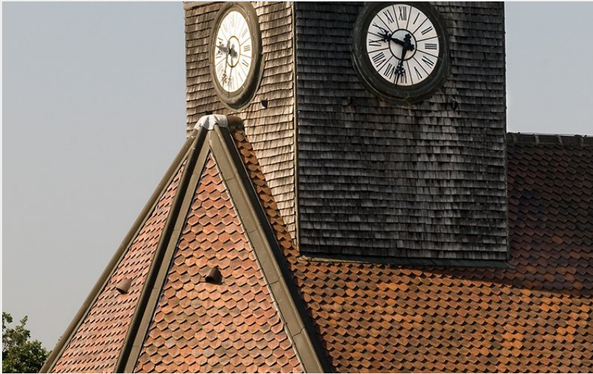
Crédit photo : TEMPLE SAINT-GEORGES À MONTBÉLIARD_1 (Jean-Mathieu Domon)