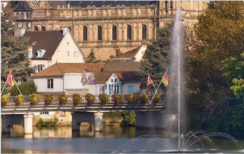
Crédit photo : EGLISE SAINT-MAIMBOEUF À MONTBÉLIARD_1 (Jean-Mathieu Domon)