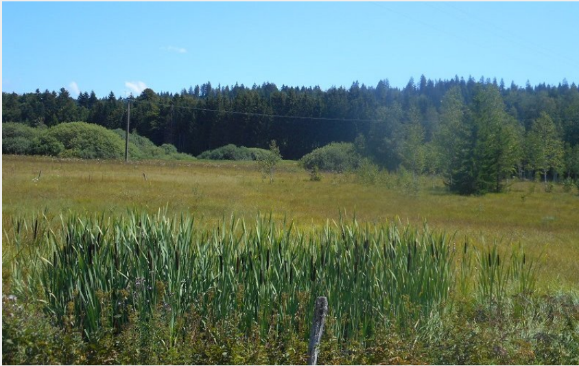
Crédit photo : TOURBIÈRES DU BIEF BELIN_1 (Tourbière du Bief Belin à Malpas)