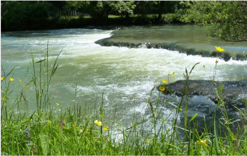
Vallée du Cusancin