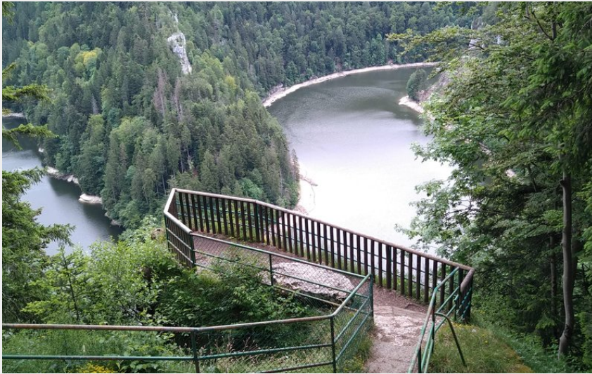
Vue du lac de Chaillexon (CCVM)