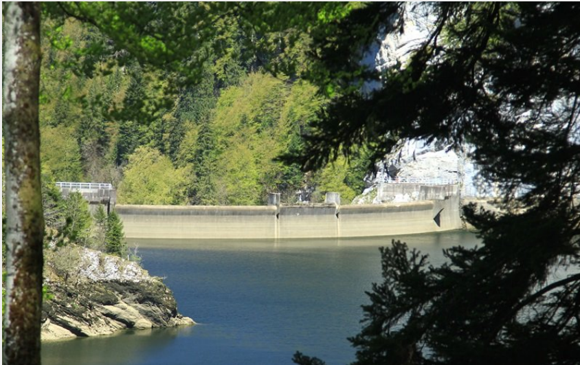
Barrage du Châtelot