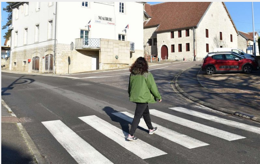
Centre du village de Boussières