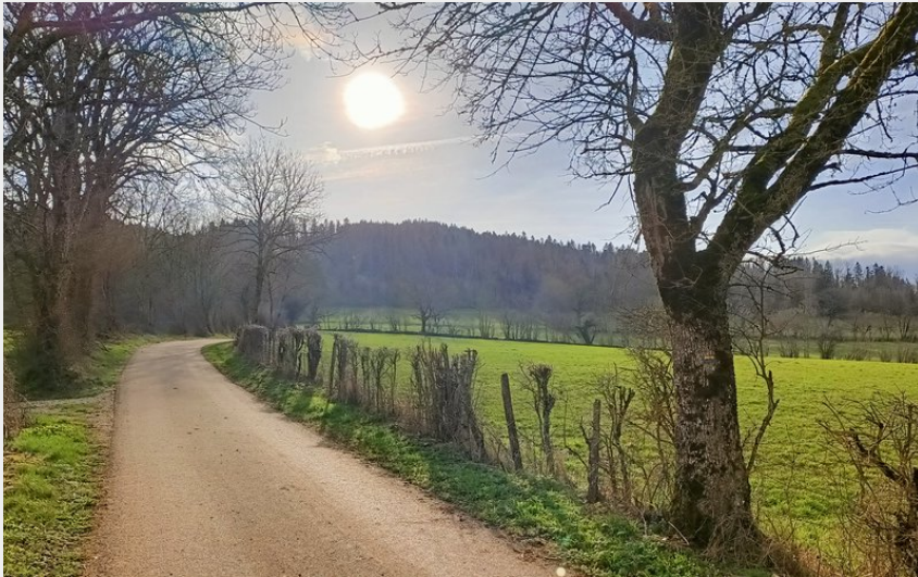
Sentier Vautran à Pierrefontaine (Portes Haut-Doubs)