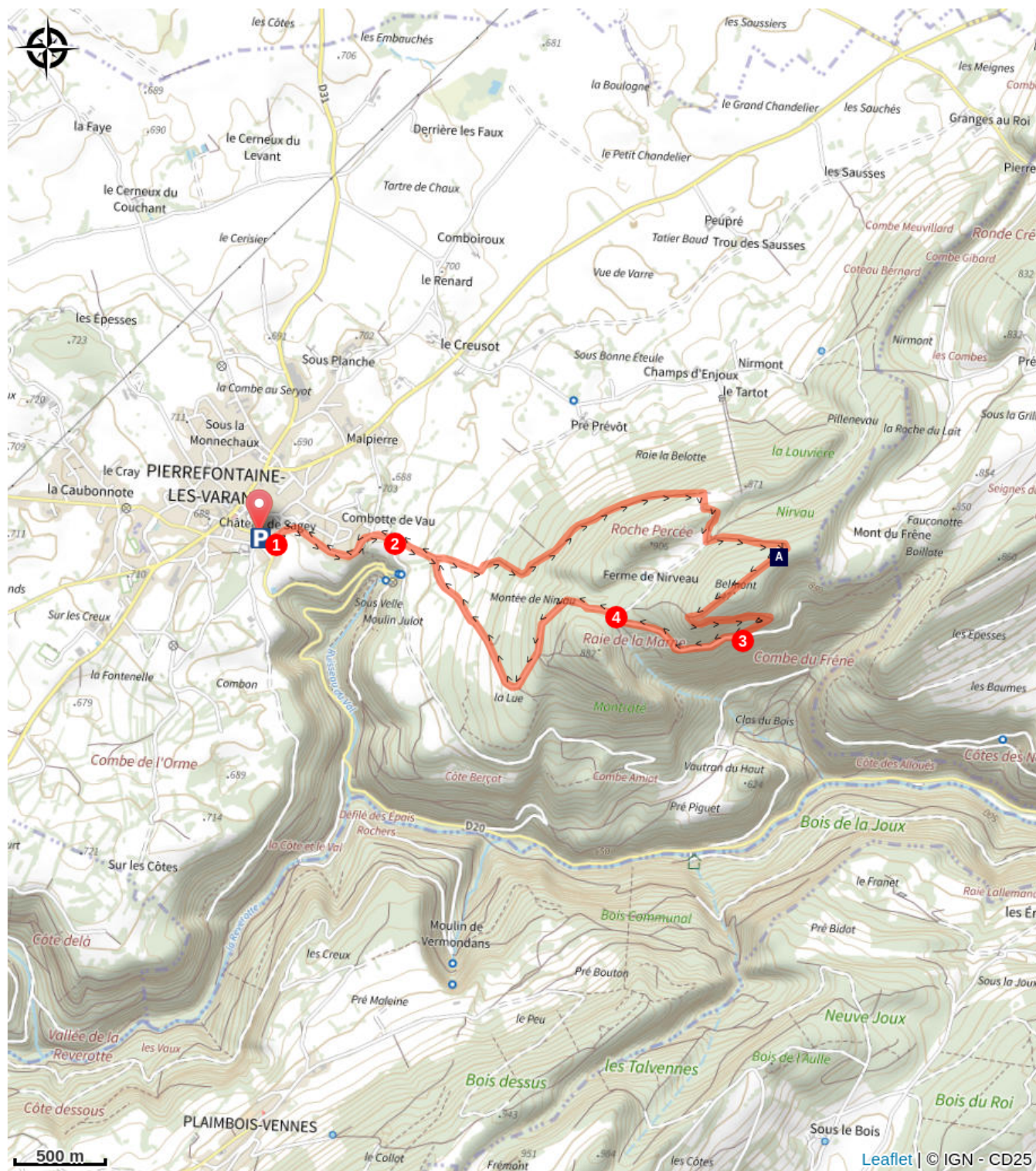
🗨 Belvédère du Belmont (A)