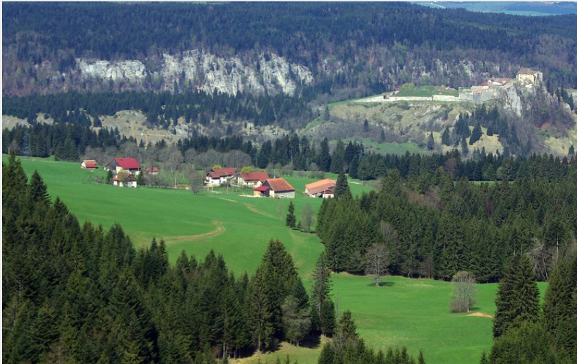
Belvédère de la Roche Sarrazine, vue sur le Château de Joux et la plaine d'Arlier