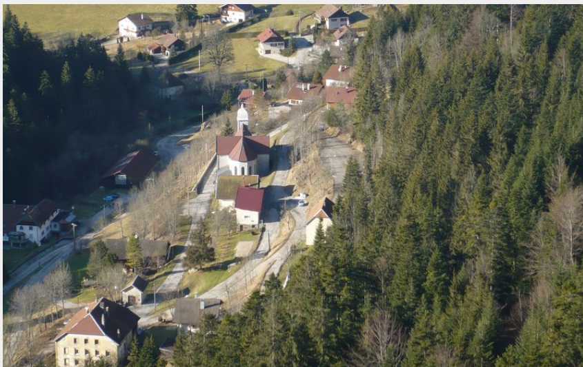
Village de Derrière le Mont (Sylvie Personeni)