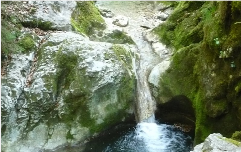
Cascade des Chaudières (CCVM)