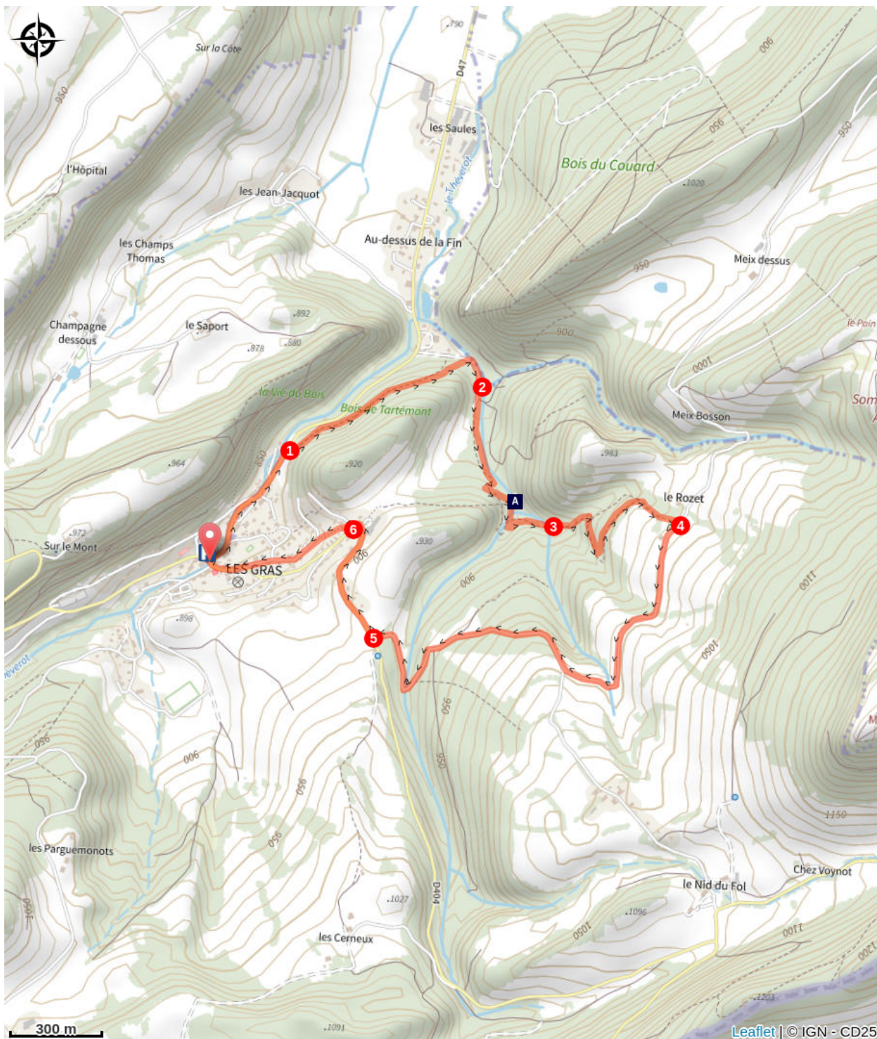
Les chaudières (A)