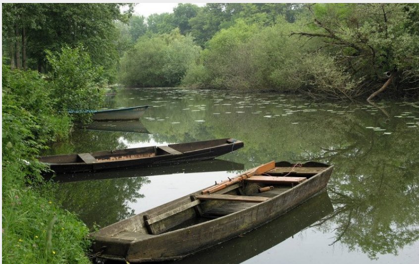
Barques sur l'Ognon