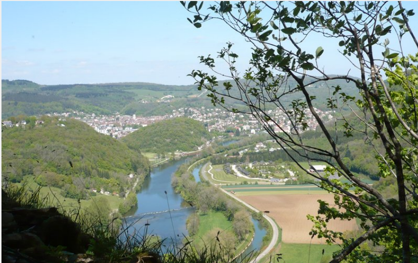
Point de vue du Mont Dommage (Office de Tourisme du Doubs Baumois)