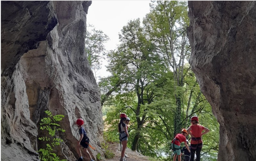
Dans la grotte de Sous Buen (Office de Tourisme du Doubs Baumois)