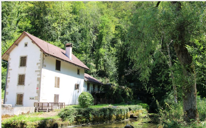
Moulin et source de la Doue