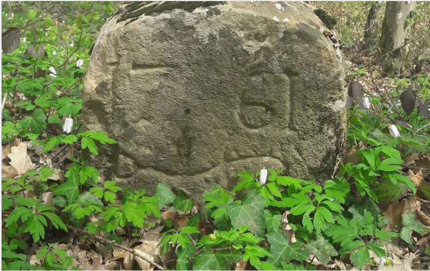
Borne du Bois Bourgeois