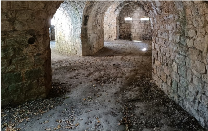
Intérieur du Fort Lachaux