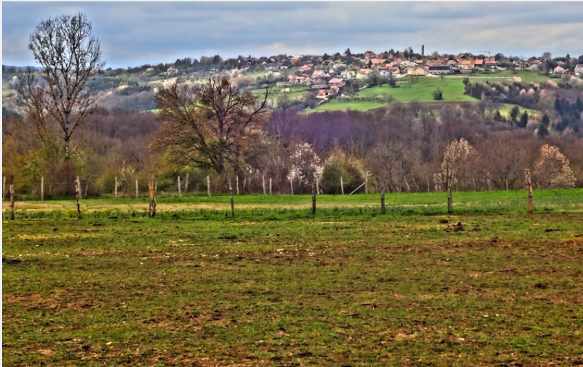
Plateau d'Écot