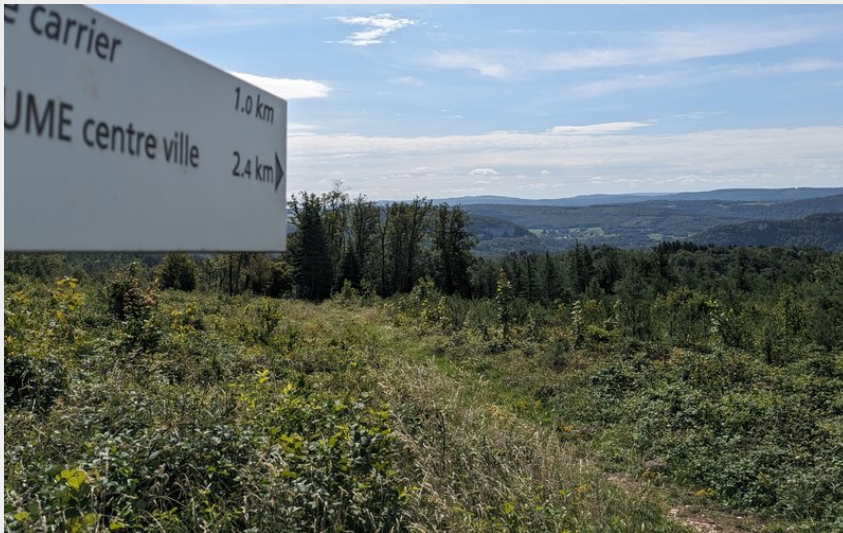
Site carrier (Office de Tourisme du Doubs Baumois)