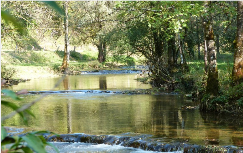
Bords du Cusancin