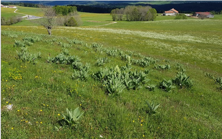
Crêt Monniot (Davy MOUGIN)