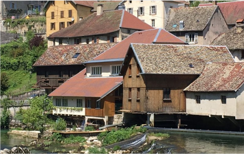
Lods, Haute vallée de la Loue