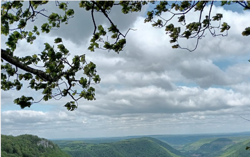
Rochers du Capucin