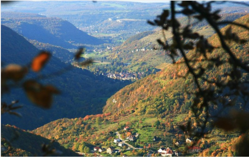
Mouthier-Haute-Pierre, le Moine de la Vallée