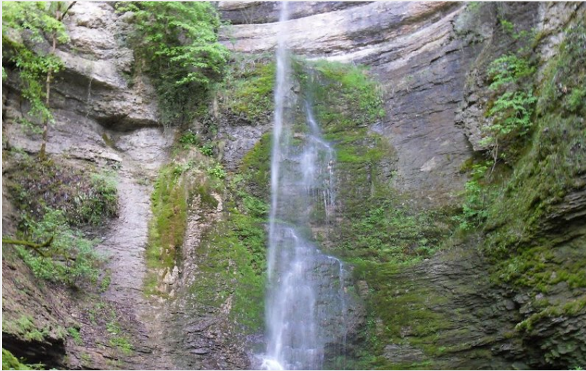
Châteauvieux-les-Fossés, Cascade du Raffenot