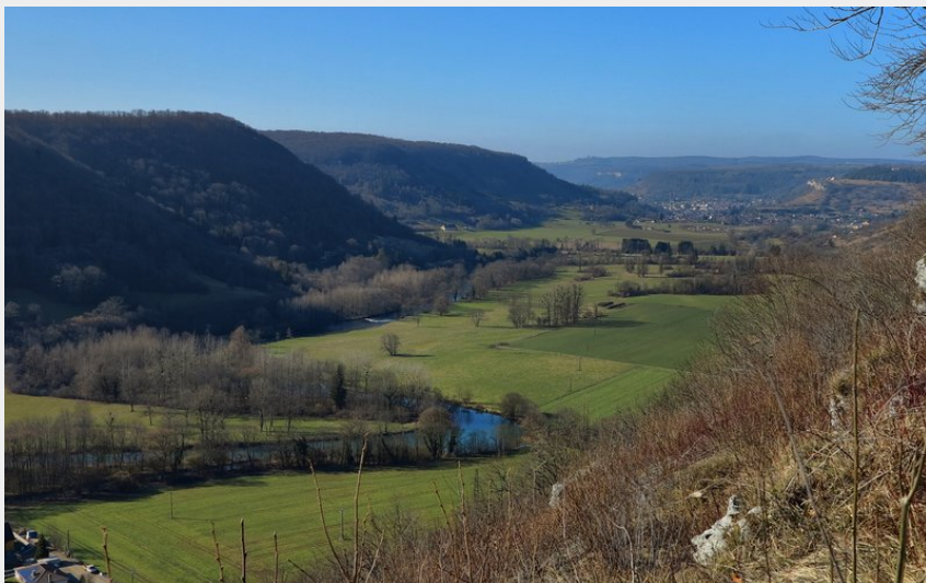
Belvédère de la Thuyère