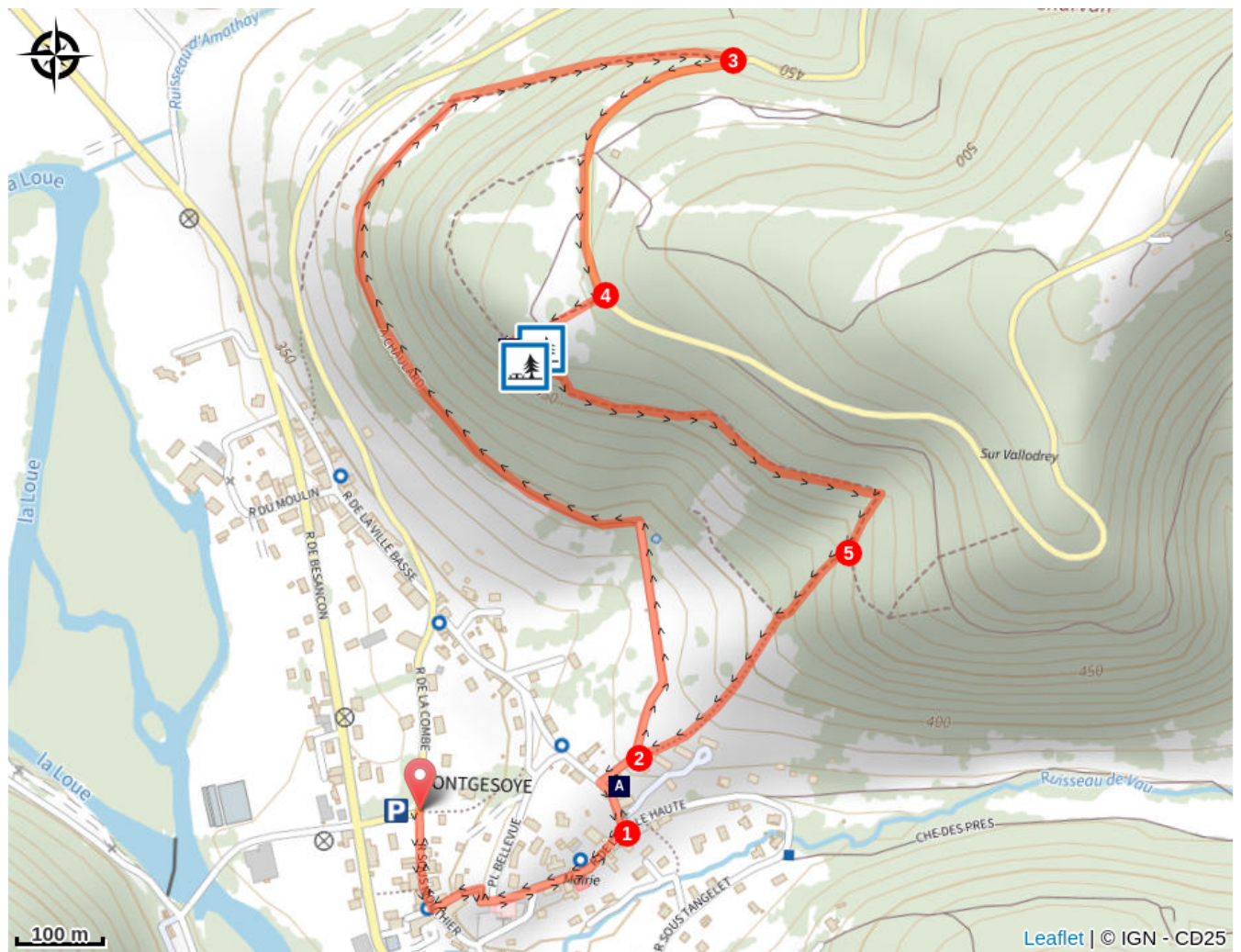
Château de Montgesoye (A)