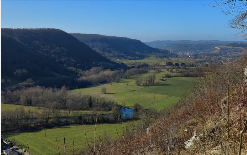
Belvédère de la Thuyère