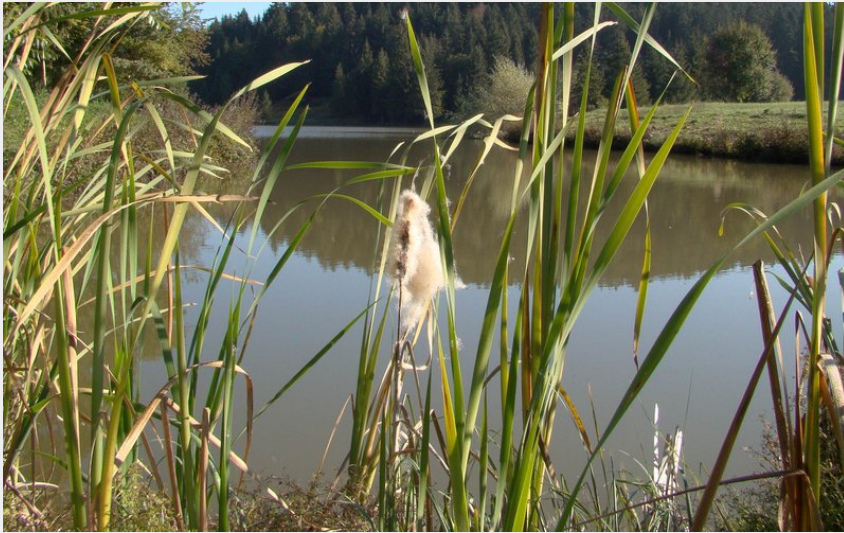
Les étangs du Bois du Roy (P.Brut)