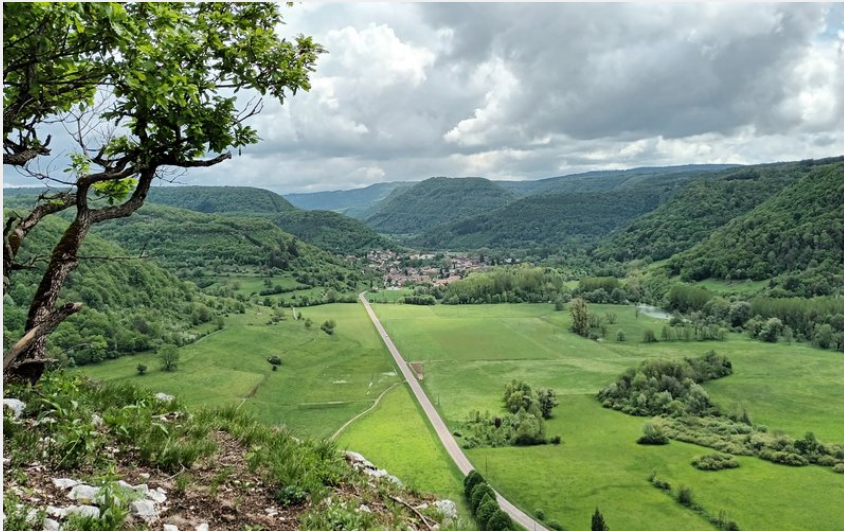
Ornans, Roche Lahier