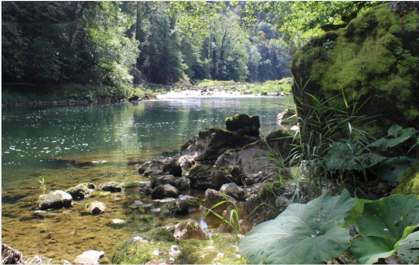
Le Doubs franco-suisse au Refrain (P.Bruot)