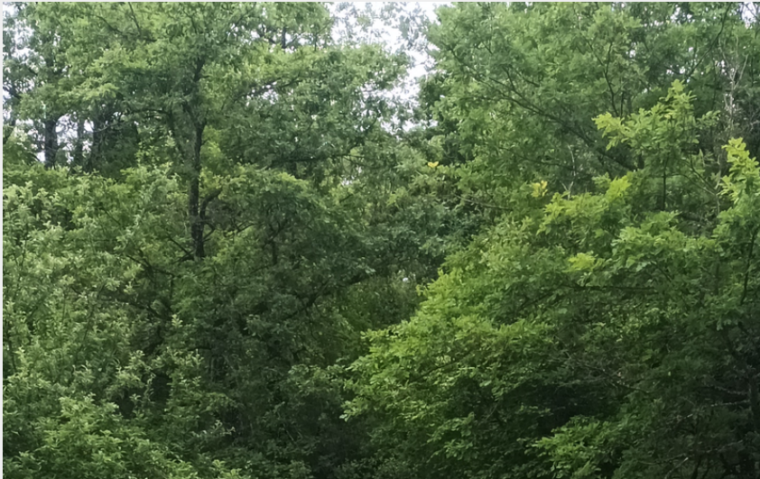
Saules, Vignes de Loray