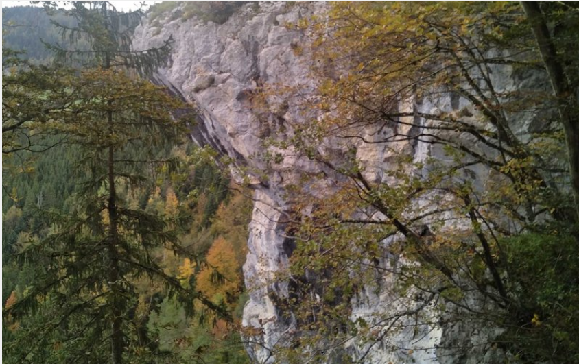
Belvédère de la Cendrée (P.Brut)