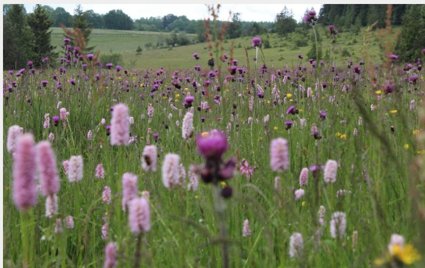
Espace Naturel Sensible du Mémont