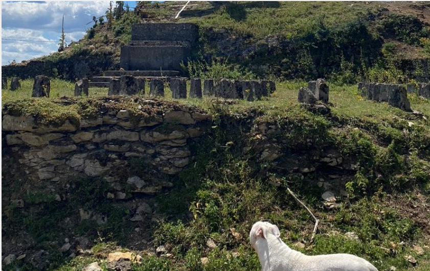
Belvédère de Montmahoux