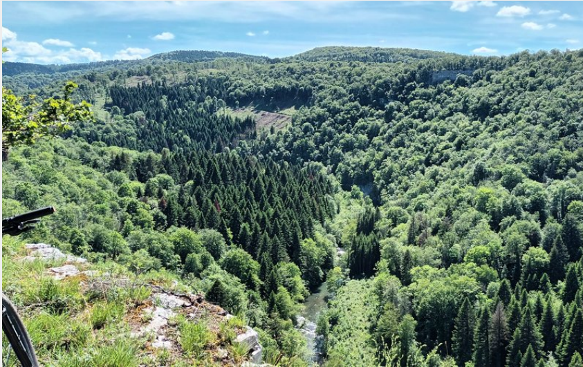
Éternoz, Les Chandeliers