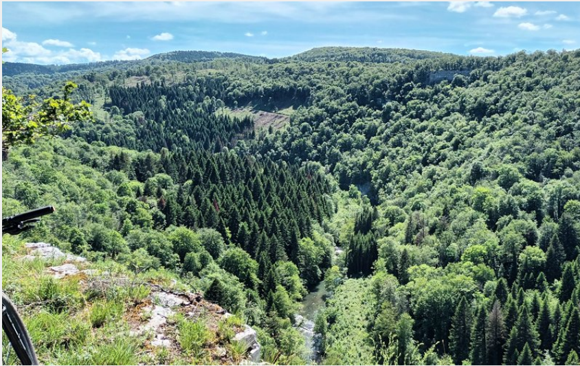
Éternoz, Les Chandeliers