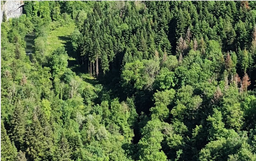
Alaise, la Gauloise