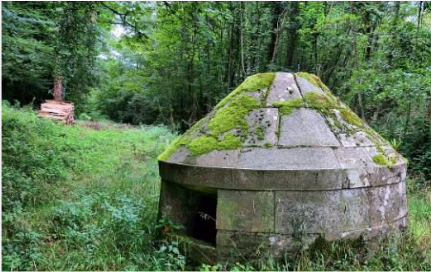
Fontaine de Valleroy (Chantal Meyer)